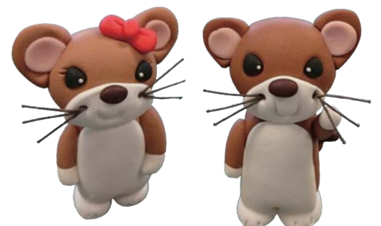
ワークショップ キャラクター粘土づくり体験