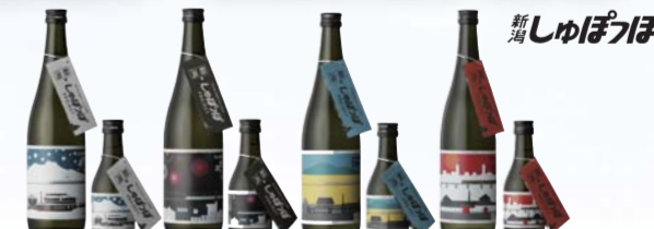
新潟しゅぼっぽ4蔵飲み比べ

“大人も子どもも楽しめる緑日”「ぷらつとホームBAR」を開催します。今回、新潟では初めての試みとなる、駅ホームの一部を貸し切つてのイベント! 当日は、駅1番線ホームと「ぼんえつ物語」客車内にお酒や地場産フルーツを使ったジュース、軽食が楽しめるコーナーを設置します。その他にも「鉄道芸人のトークライブ」や「キャラクター粘土づくり体験」等を開催し、イベントを盛り上げます!