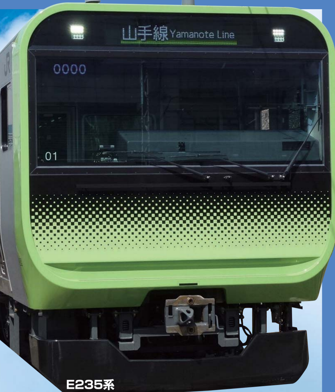
*実施内容は天候等により変更・中止となる場合があります。予めご了承ください。

新潟支社管内を走る「のってたのしい列車」のパンフレットを ご用意の他、顔出しパネルもご用意しますので、記念撮影に ご活用ください!