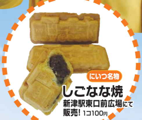
にいつ名物 しこなな焼 新津駅前広場にて販売! 1こ100円