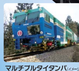
マルチプルタイトンバ(イメージ)