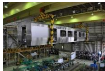
車体のクレーン移動