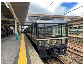
12系ばんえつ物語客車