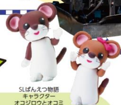
SLばんえつ物語 キャラクター オコジロウとオコミ